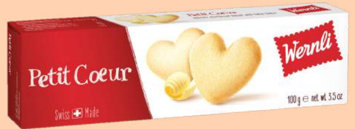
8001000 | Butterherzli → Zartes Mürbgebäck mit Schweizer Butter