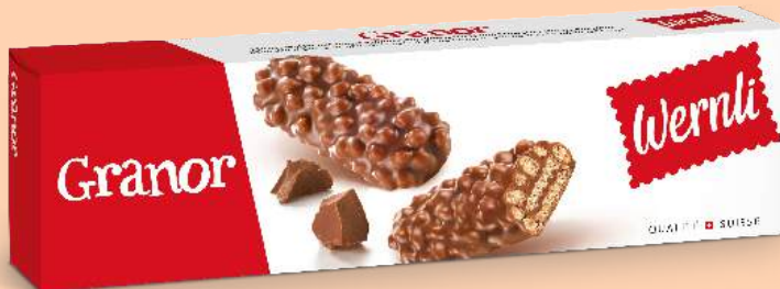
9160000 | Granor → Waffel mit feiner Kakaocrème und Knusperreis