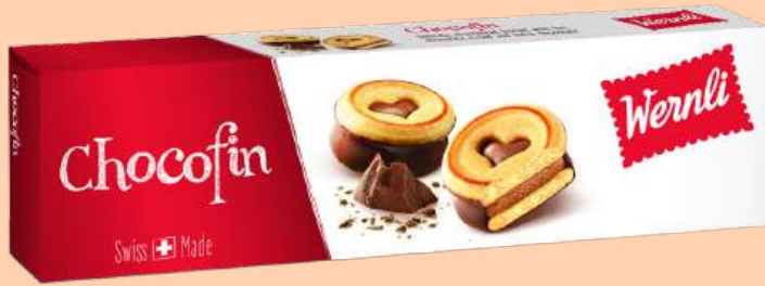
9073000 | Chocofin → Zartes Mürbegebäck mit feiner Schokocrème-Füllung