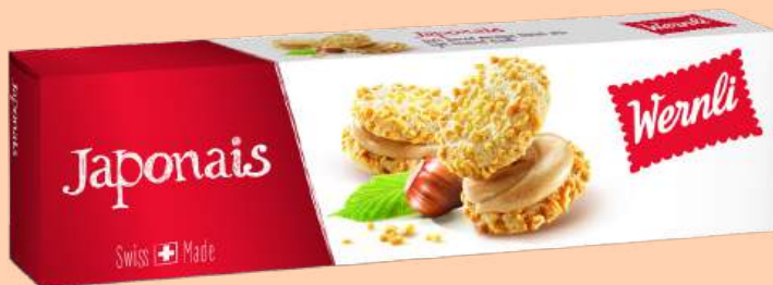
9163000 | Japonais → Eiweißgebäck mit Haselnusscrème-Füllung