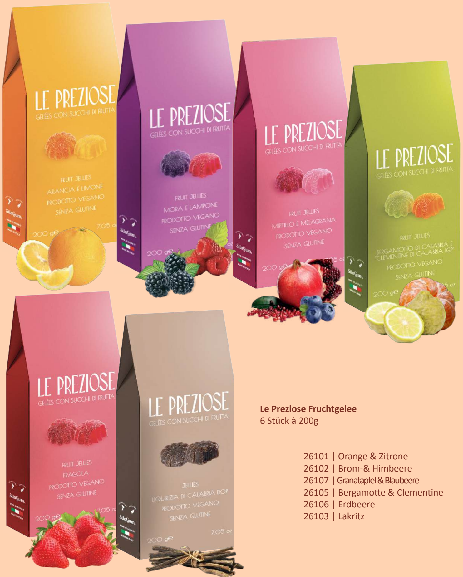
Le Preziose Fruchtgelee 6 Stück à 200g